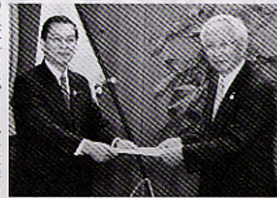
大島経産相(左)に手渡す岡村会頭

提言では、中小企業は「取り込み、国内の雇用拡大、グローバルな視点で競争力の強化を図り、ビジネスを創出、拡大する必要があり」とし、アジアの中間所得層の需要を内需に